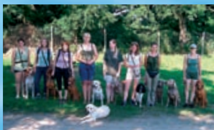
Možnost loveckého výcviku ocenili všichni účastníci kursu

jí věnují stejně pilně jako výchově psů. Budoucí vůdci se naučí správně pracovat se svým psem loveckým způsobem, učí se jak se chovat na zkoušce lovecké upotřebitelnosti a co je tam může potkat. Neméně důležitá je výchova vůdců formou konzultací, kde se dozvědí, jak vlastně jejich zkouška vypadá, a vyřeší případné potíže, které by mohly nastat. V Brodu si poradí stejně dobře s výcvikem retrívra jako ohaře či španěla. Je to způsobeno velmi pružným a variabilním přístupem ke každému psovi. I v rámci plemene je každý jedinec jiný.